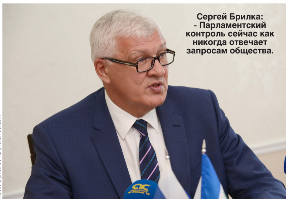
Сергей Брилка: - Парламентский контроль сейчас как никогда отвечает запросам общества.

Спикер Государственной Думы ФС РФ Вячеслав Володин отметил, что одна из задач парламентариев состоит