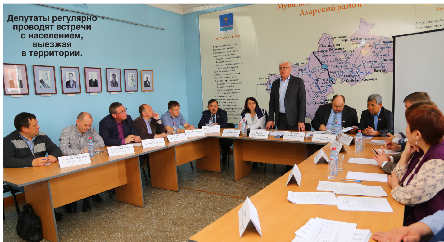
Депутаты регулярно проводят встречи с населением, выезжая в территории.

- Можно сказать, что Законодательное Собрание Иркутской области уловило общемировой тренд?